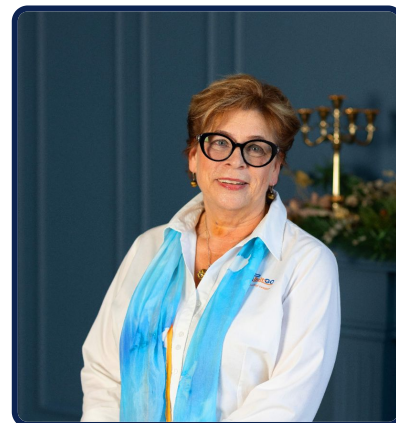
Valda Pravarne Ekskursijas gids

Atgriešanās Siguldā – 21.40, Cēsīs 22.30, Valmierā 23.00.